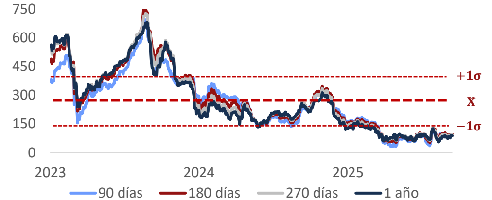
Saldo en circulación mensual de TCO

Cifras en COP billones, datos con corte a 31 de agosto de 2025